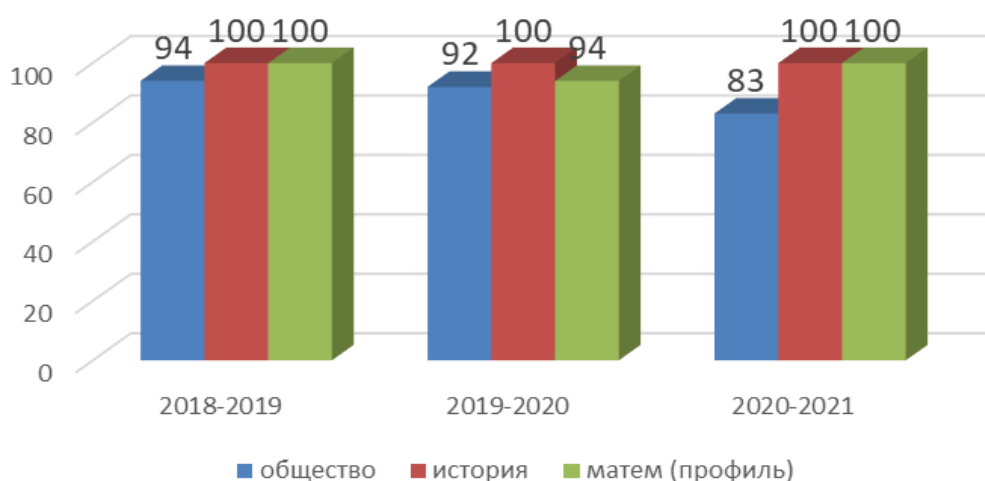
Динамика результатов ЕГЭ по предметам, изучавшимся на профильном уровне