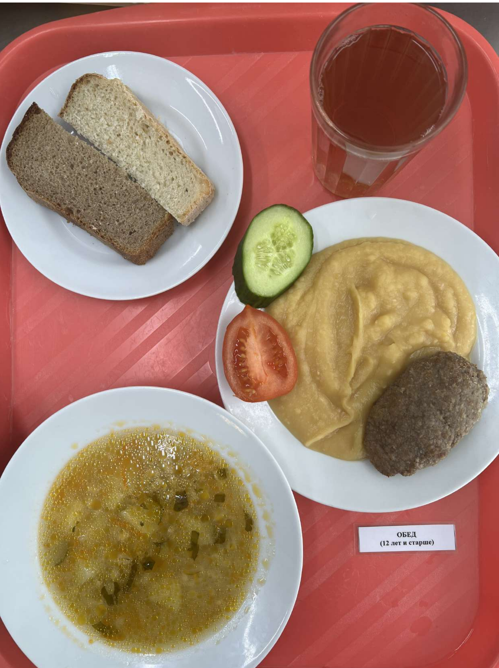
ОБЕД (12 лет и старше)