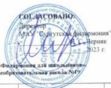
График проведения филармонических уроков в рамках реализации проекта «Филармония для школьников» Муниципальное бюджетное общеобразовательное учреждение средняя общеобразовательная школа №19